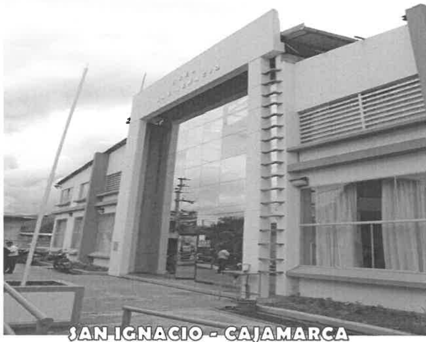
SAN IGNACIO - CAJAMARCA