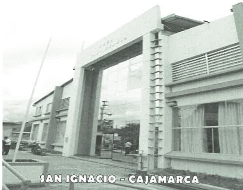
SAN IGNACIO - CAJAMARCA