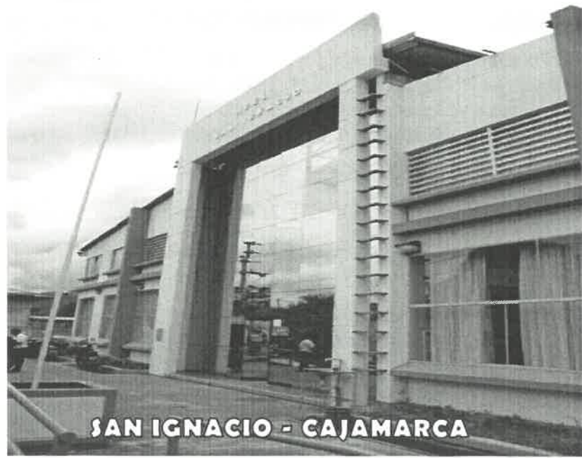
SAN IGNACIO - CAJAMARCA