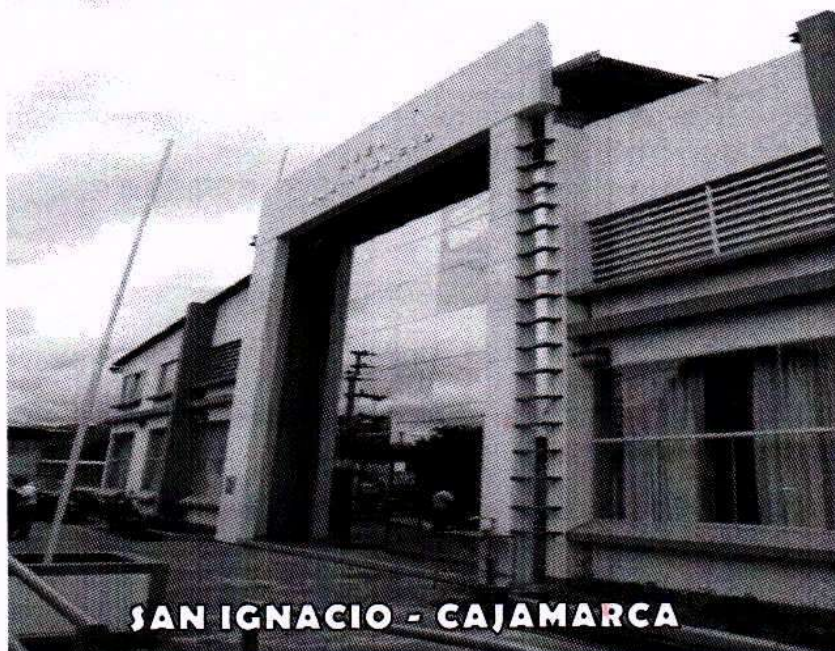
SAN IGNACIO - CAJAMARCA

PARA LA CONTRATACIÓN ADMINISTRATIVA DE SERVICIOS DE PERSONAL EN PLAZAS DE ESPECIALISTAS PARA EL FORTALECIMIENTO DE LA GESTIÓN ADMINISTRATIVA E INSTITUCIONAL, BAJO EL RÉGIMEN ESPECIAL DE CONTRATACIÓN ADMINISTRATIVA DE SERVICIOS – CAS AÑO 2023 - UGEL SAN IGNACIO.