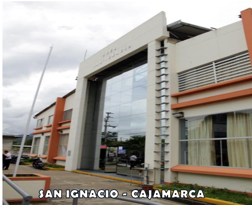
SAN IGNACIO - CAJAMARCA